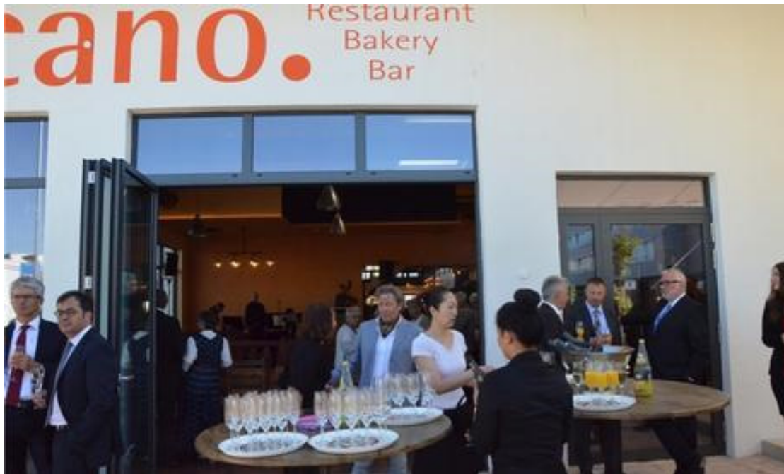
Bildergalerie zur Eröffnung des Fachmarktzentrums